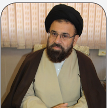
۹. حجت ضر از دوست

انسان چون یک موجود اجتماعی است. ناگزیر است که باافرادجامعه ارتباط نیکوداشته باشد. به جامعه نفع برساند وازمنافع جامعه استفاده کند.